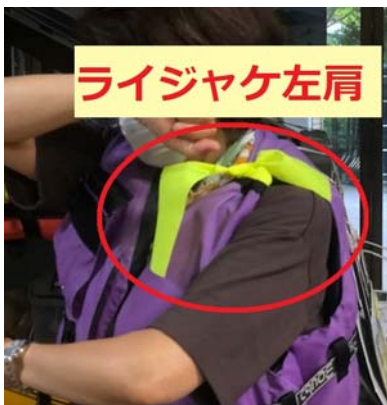
リボン_ライフジャケット左肩